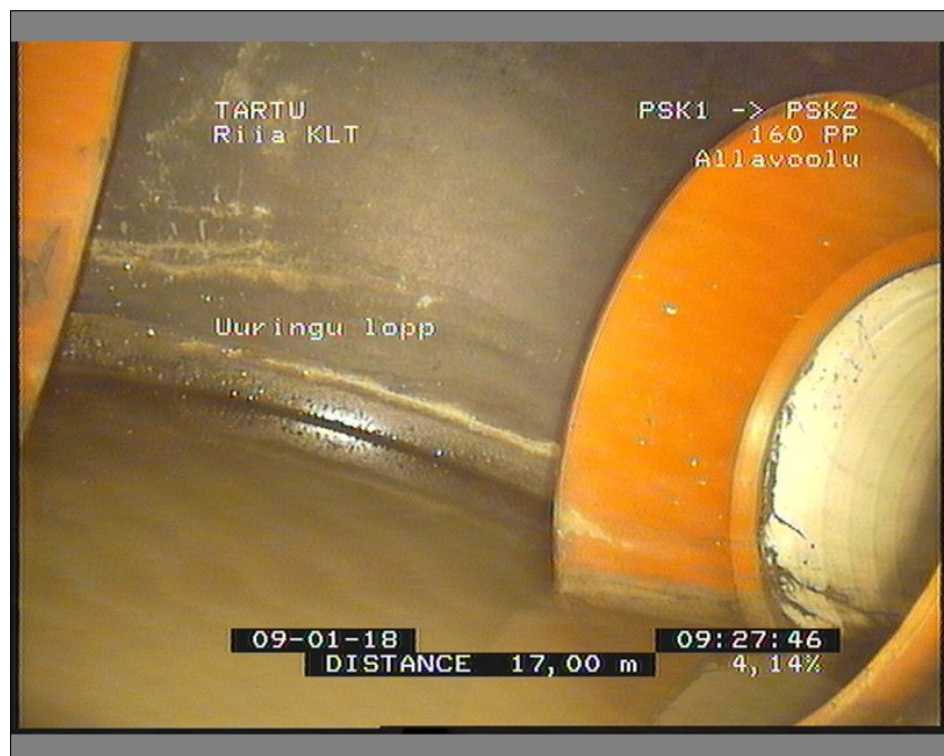
Pilt: PSK1_PSK2_1_092824_2_A.JPG, 00:01:19 17m, Uuringu lõpp