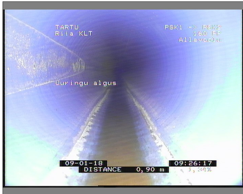
Pilt: PSK1_PSK2_1_092655_1_A.JPG, 00:00:00 0,9m, Uuringu algus